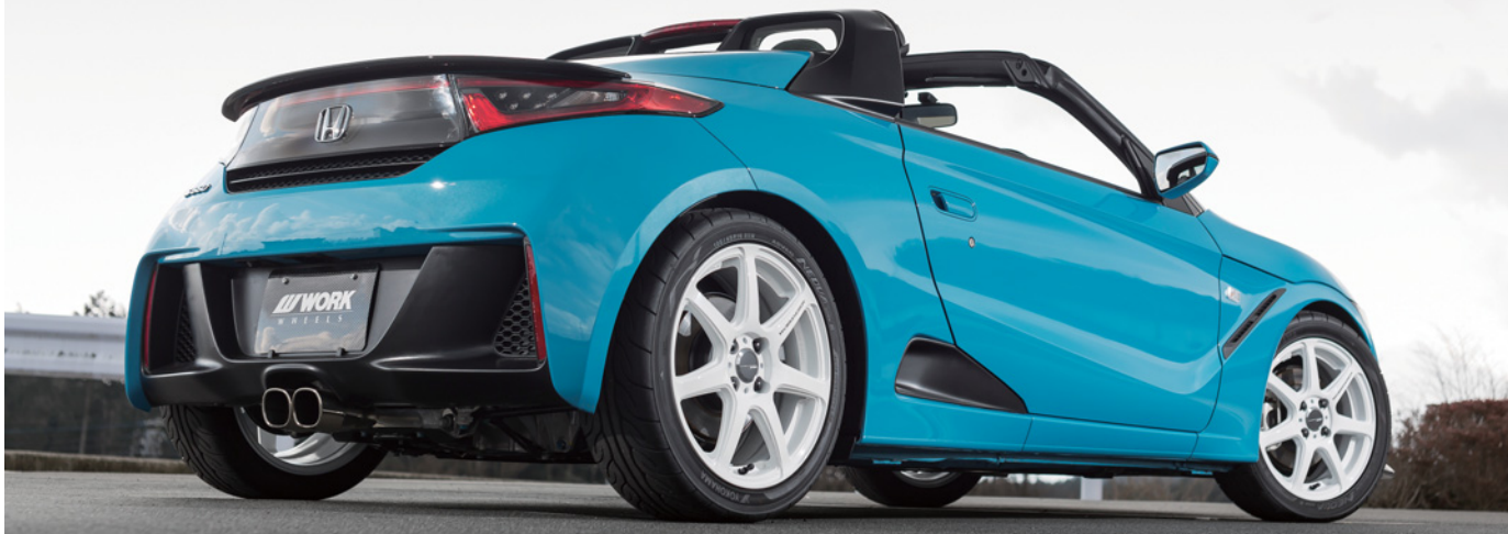
※装着画像はイメージです。