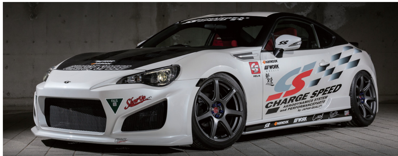
※装着画像はイメージです。